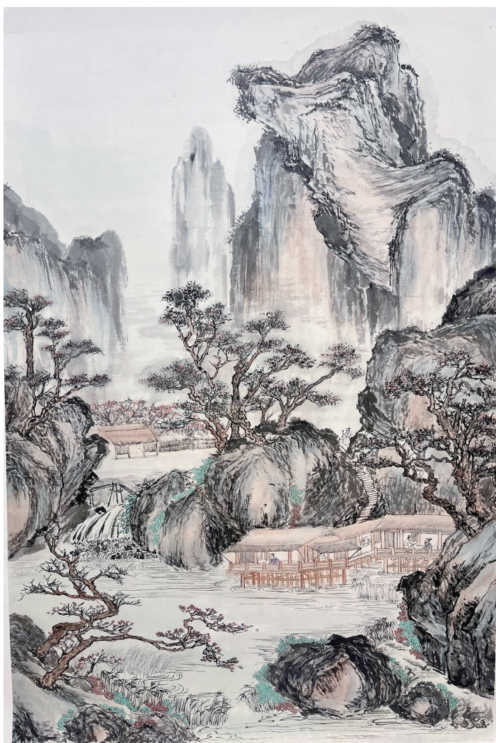
□ 张家琦 上实东滩高中 高二(4)班

追寻生活意义的路上,愿我们都能拥有自我选择的勇气,愿我们扎根于泥土之中,仍能摇晃在风中,抬头仰望群星闪烁。