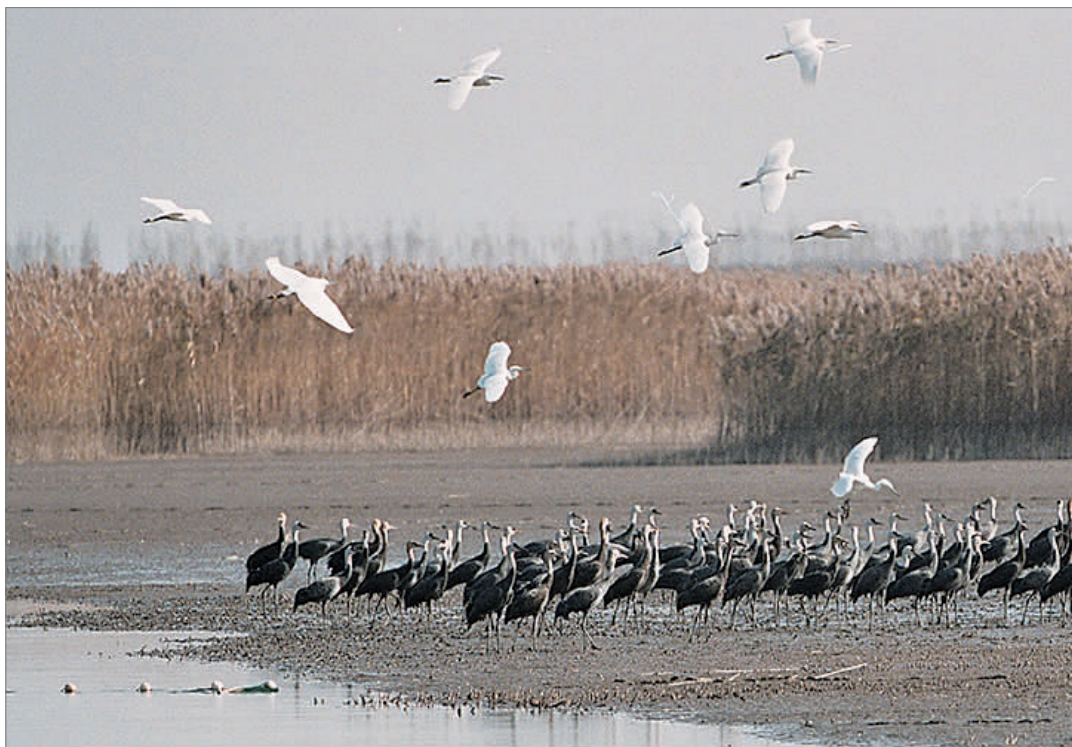
▲ 东滩湿地,鸟儿自由翱翔

崇明明有着白头鹤之乡的美誉,连续多年白头鹤记录数量达百只以上。目前,东滩白头鹤数量超过50只,工作人员称,随着气温下降,白头鹤数量还将继续上升。