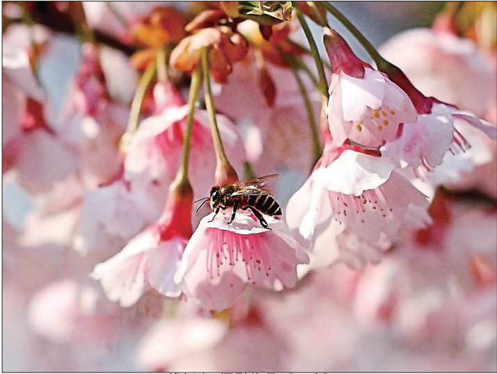
钱振兴 摄影作品《闻香》

人生之尺,对某些人是财富、指南针、定盘星。有了它,平平安安、高高兴兴,洒脱快乐一辈子。