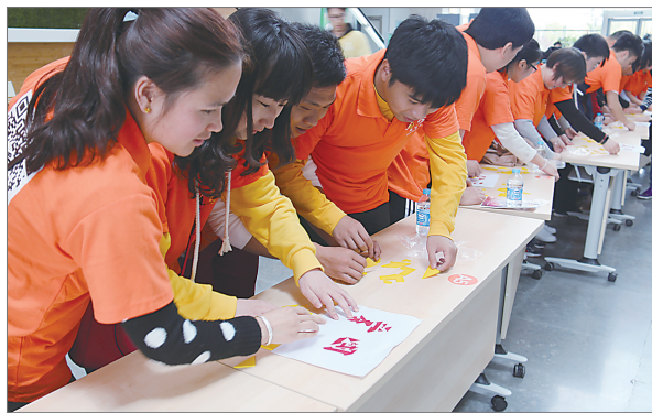
▲ 团员青年在挑战活动中比拼