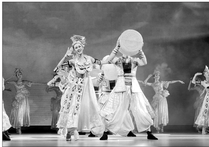
▲演员们带来精彩演出