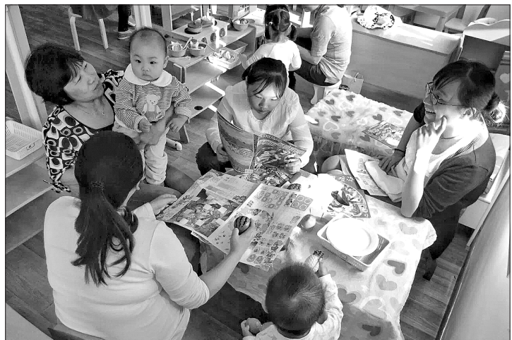
▲亲子俱乐部内其乐融融