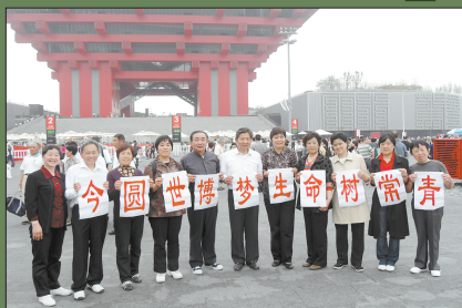
百年世博今梦圆,走向幸福靠拼搏