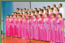
引吭高歌驱痼疾,第三人生绽新绿