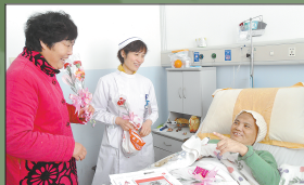
抗癌明星心系病友,深入病房促膝谈心