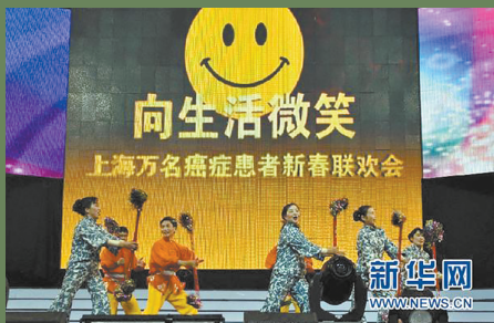
表演唱《我侬康协好来坳去话伊》剧照