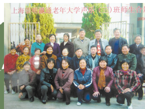
以老年大学声乐3班为依托培养文艺骨干