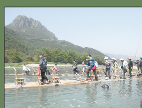
会员旅行途中,兴致盎然