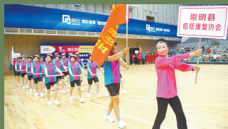
参加长三角运动会的康协运动员英姿飒爽