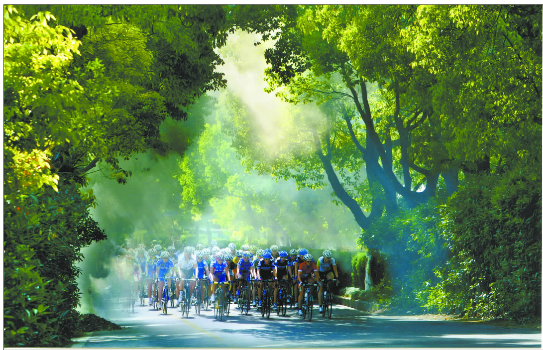
袁德庆《晨练》摄影作品

是什么原因让我重新想起那辆曾是我生命中如至宝般的自行车？那就是我有幸连续数年当上了环崇明岛女子国际公路自行车比赛的志愿者。每一次当我被抽调到草港公路来维持秩序时，看到那壮观的场面，那隆重的氛围，那宏伟的气势，我的心情总是格外地激动，我的情绪总是格外高涨。而每当我看到那些强健的车赛选手们如风一般地从我眼前冲过，我的心中总有一种无法言状的激情。哦！崇明的自行车赛已经从精英赛，到国内赛，再到国际赛，整整十个年头，生态崇明已经走向了世界。因为有了车赛，我重拾起年少时的梦想，因为有了车赛，让我对车有