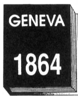
签署第一份日内瓦公约